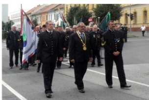
Banícky sprievod ulicami mesta

Pri tejto príležitosti sa uskutočnili i sprievodné akcie.