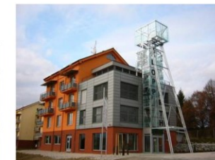
Banícká veža na Baníckom námestí