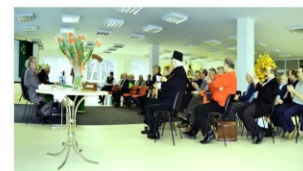
Valné zhromaždenie banického spolku