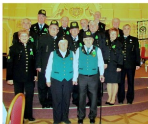
Predsedenstvo Banického spolku Spiš