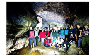
Návšteva Medvejdej jaskyne v Slovenskom raji