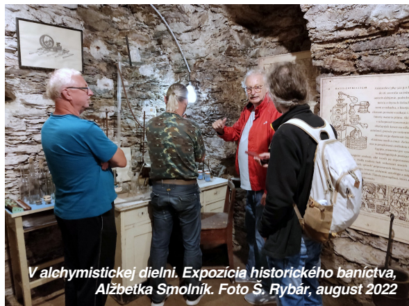
V alchymistickej dielni. Expozícia historického baníctva, Alžbetka Smolník. Foto Š. Rybár, august 2022

Pre priamy kontakt so záujemcami v Smolníku je k dispozícii Infodom, ktorý stojí pri