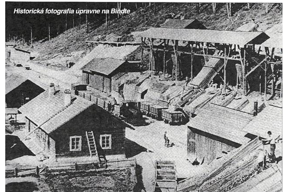
Historická fotografia úpravne na Bindte

Prvou spoločnosťou, ktorá začala v roku 1856 s kupovaním banských polí na Spiši, bola Těšínska komora arcikniežata Albrechta Rakúsko-Těšínskeho, člena panovníckeho rodu Habsburgovcov. Vyhľadala si ložisko Bindt, kde pred jej vstupom do miestneho banského podnikania pôsobili početné drobné ťažobné spoločnosti – ťažiarstva (nemecky Gewerkschaft ). Odkúpením bani od týchto ťažiarstiev si Cisárska a kráľovská rudná spoločnosť arcikniežata Albrechta z Viedne („ Sc. K. und kön.